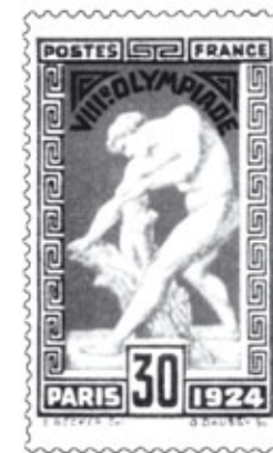
A sinistra: Statua di Milone di Edme Dumont, 1768, Parigi, Museo del Louvre. A destra: Milone di Crotone, francobollo commemorativo emesso dalle Poste francesi, in occasione delle Olimpiadi di Parigi del 1924.

Gli interessati possono richiedere il libro presso: